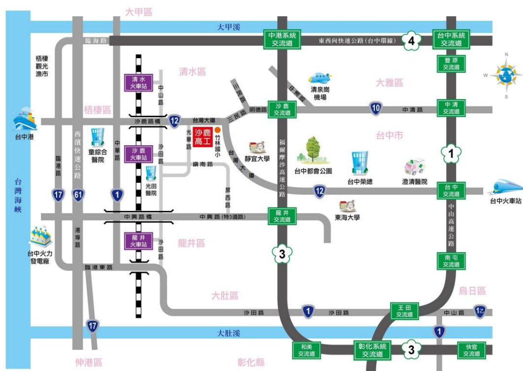
附圖一承辦學校（臺中市立沙鹿工業高級中等學校）位置圖